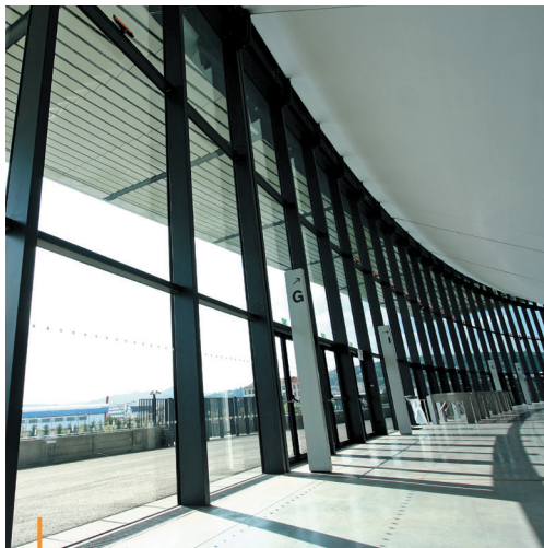
Zenith (42) – Client : Ville de St-Etienne / Zenith – Archi : Foster and Partners / Cabinet Berger

Réalisation de menuiseries acier intégrant des caractéristiques techniques de résistance au feu, de rupture de pont thermique, d'efficacité acoustique et AEV.