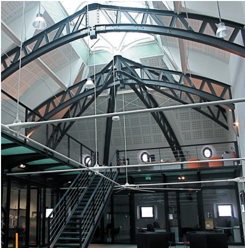
BU Lyon 2 (69) - Client : Ville de Lyon - Archi : Frédéric Brachet

Structure métallique composée d'ossatures primaire et secondaire.