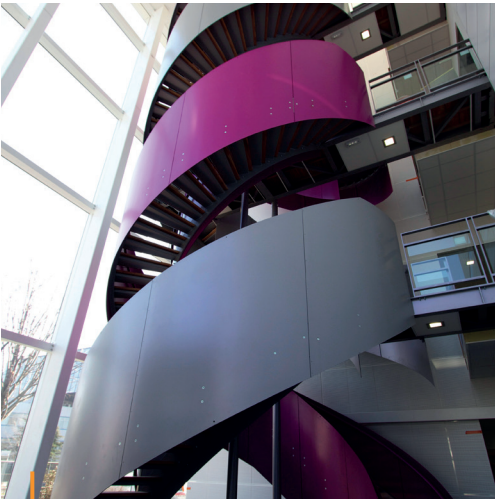
ICLF (69) - Client : Département du Rhône - Archi : Unanimes Architectes

Supports en acier, aluminium ou inox : débit ou pliage de matière, poinçonnage, découpe plasma ou laser, sérigraphie, travail de tôlerie fine, traitement de surface.