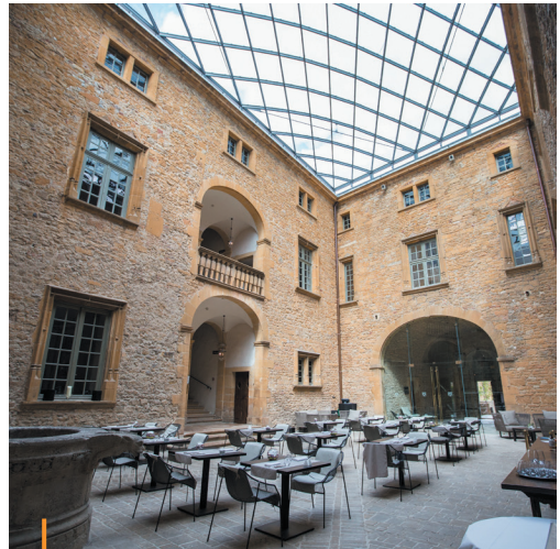
Château de Bagnols (69) - Client : Château de Bagnols - Archi : AIA Architectes

Mise en œuvre d'un savoir-faire artisanal pour restaurer des bâtiments classés, force de proposition lors de la conception et de la réalisation technique.