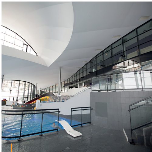
Aquamation Courchevel (73) – Client : Ville de St-Bon – Archi : Studio Arch

Création de fenêtres, châssis fixes et ouvrants, baies coulissantes, façades vitrées, verrières, occultations et protections solaires.