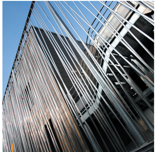
Le Fil (42) - Client : Ville de St Etienne - Archi : XXL Ateliers

Fabrication d'escaliers, de garde-corps, de mains courantes, de balcons, de portails, et rénovation de ferronnerie d'art.